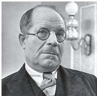
Рис. 2. Академик Николай Нилович Бурденко — заведующий кафедрой нейрохирургии ЦИУВ в 1935—1946 гг. Fig. 2. Academician Nikolay Nilovich Burdenko — is the head of neurosurgical department of CPhCEI during period from 1935 till 1946.