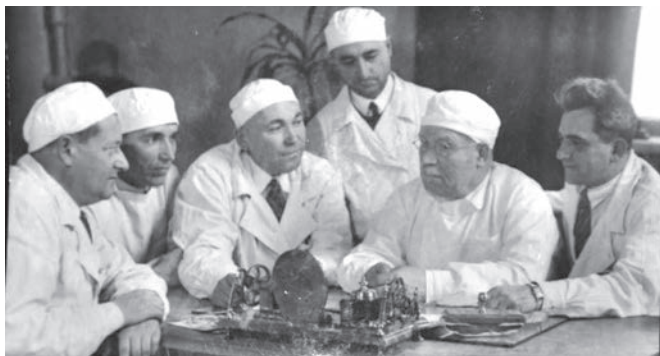
Рис. 3. Профессор Н.Н. Бурденко с коллегами (1940 г.). Fig. 3. Professor N.N. Burdenko with colleagues (1940).