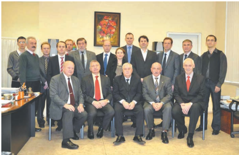
Рис. 13. Сотрудники кафедры нейрохирургии РМАПО (2014 г.). Fig. 13. The staff members of neurosurgical department of Russian Medical Academy of postgraduated education (2014 г.).

ронеурхирургии, на которых прошли обучение множество нейрохирургов нашей страны.