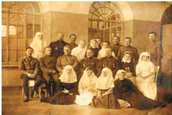
В.М. Бехтерев и Л.М. Пуссеп с сотрудниками Петроградского военного лазарета им. Н.И. Пирогова

V.M. Bekhterev and L.M. Pussep with staff of the Petrograd Military Hospital named after N.I. Pirogov