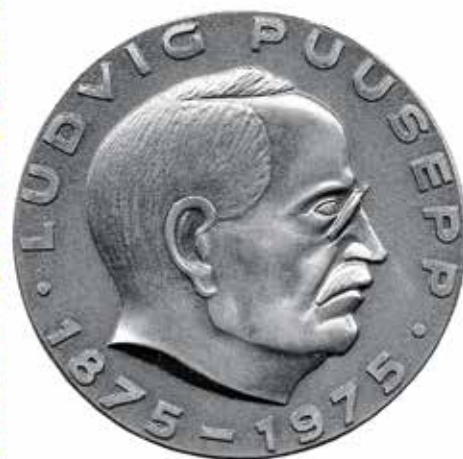
Л.М. Пуссеп – доктор honoris causa Вильнюсского университета (1929 г.). Памятник Пуссепу в г. Тарту. Памятная медаль к 100-летию со дня рождения Л.М. Пуссеп L.M. Pussep – Doctor honoris causa of the Vilnius University (1929). L.M. Pussep monument in Tartu. Memorial medal for 100th anniversary of L.M. Pussep's birth

включается в реорганизацию Тартуского университета и введение советской системы здравоохранения. В 1941 г. он посетил Ленинград и Ленинградский нейрохирургический институт, встречался с коллегами, отдыхал в Ялте. Кстати, с уверенностью можно предположить, что, если бы Людвиг Мартинович не покинул Советскую Россию, именно он возглавил бы открытый в 1926 г. Ленинградский научно-практический институт хирургической невропатологии (носящий ныне имя А.Л. Поленова), поскольку нейрохирургов, обладавших его опытом и уровнем знаний, в стране не было.